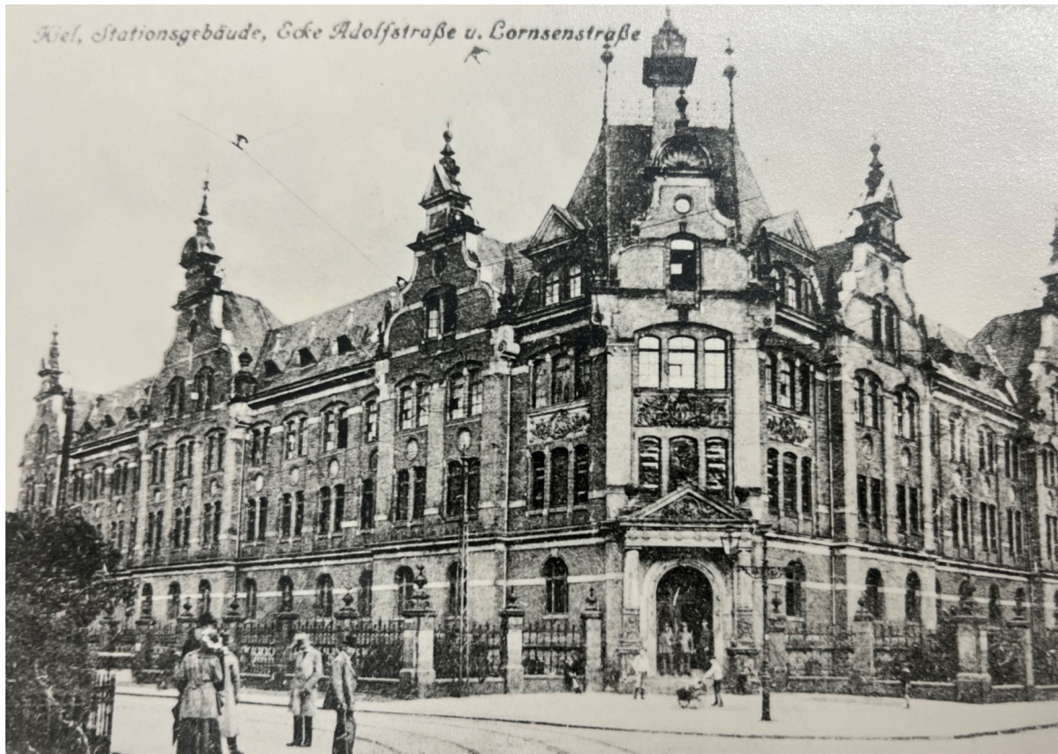
Landesfinanzamt Schleswig-Holstein (1933). Kiel, Ecke Adolfstraße/Lornsenstraße.