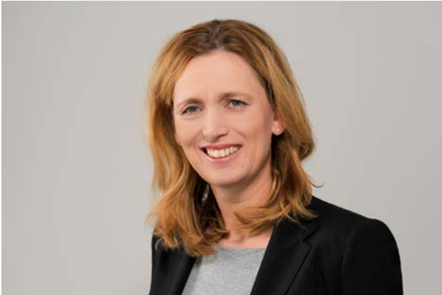
Karin Prien, Ministerin für Bildung, Wissenschaft und Kultur