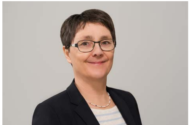
Monika Heinold, Finanzministerin