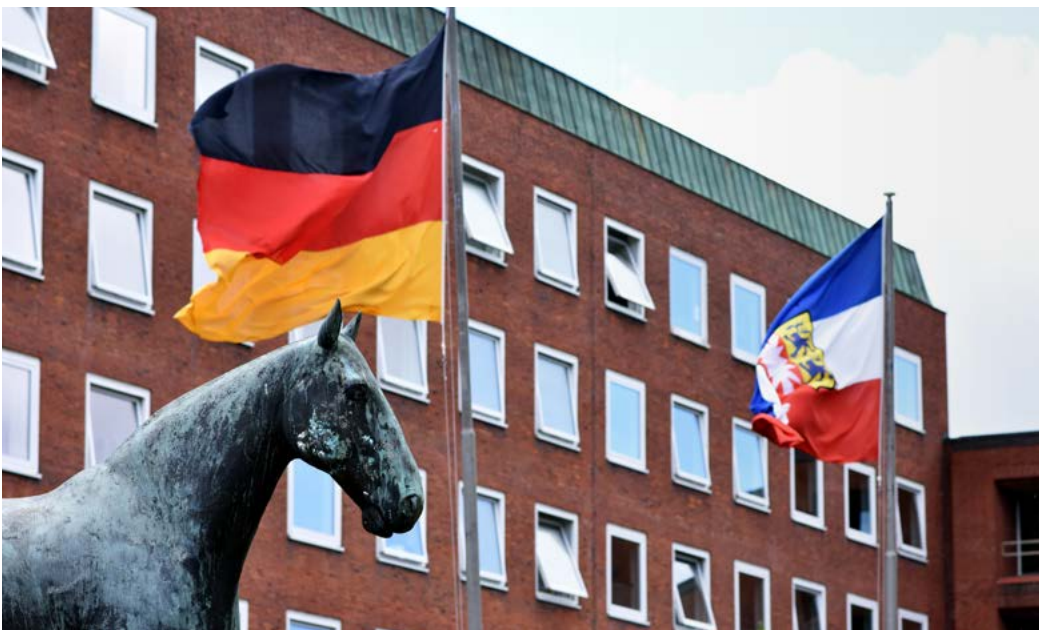
Der Sitz der Staatskanzlei, der obersten Landesbehörde Schleswig-Holsteins.