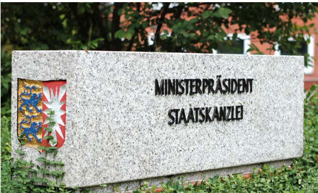
Eingang der Staatskanzlei.