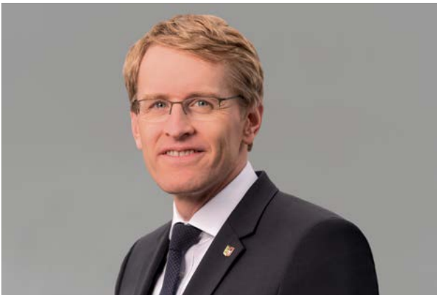
Daniel Günther, Ministerpräsident