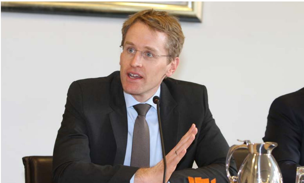
Ministerpräsident Daniel Günther.