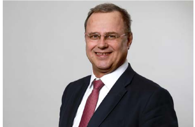
Claus Christian Claussen, Minister für Justiz, Europa und Verbraucherschutz