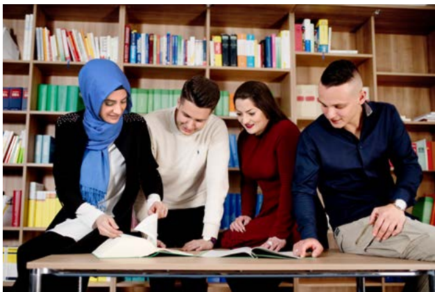
Nachwuchskräfte in der Steuerverwaltung Schleswig-Holsteins.

Innerhalb der vollziehenden Gewalt ist die staatsleitende Tätigkeit der Landesregierung zu unterscheiden von der Verwaltung im eigentlichen Sinne, die öffentliche Aufgaben gegenüber den Bürgerinnen und Bürgern, insbesondere den Gesetzesvollzug, wahrnimmt. Kennzeichnend für diese Verwaltung ist ein Netz hierarchisch strukturierter Behörden und Einrichtungen unterhalb der Landesregierung. Schleswig-Holstein gehört dabei zu den Bundesländern, die ihren Behördenapparat zweistufig organisieren. Neben der ersten Stufe – oberste Landesbehörden und Landesoberbehörden – existiert eine zweite Stufe, die von den unteren Landesbehörden gebildet wird. Andere Bundesländer wie etwa Hessen oder Nordrhein-Westfalen haben zwischen obersten Landesbehörden und unteren Landesbehörden noch eine Mittelinstanz eingezogen, die als Bezirksregierungen bzw. Regierungspräsidien Verwaltungstätigkeit ausüben.