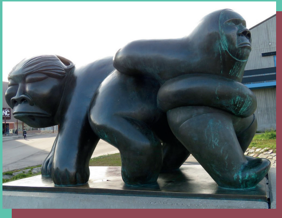
Kaassassuk-Skulptur in Nuuk, Grönland Simon Kristoffersen